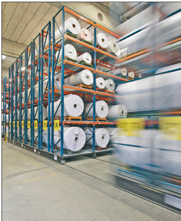
Ein Blick in die Hallen des deutschen Sihl-Werks in Düren

geringe Opazität zu Einbußen bei der Bildqualität. Auch „Steifigkeit und Oberfläche sind nicht mit denen einer PET-Folie zu vergleichen“, erläutert Stefan Bruch.