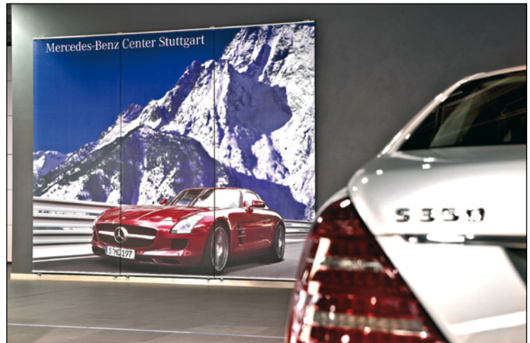
Sihl entwickelte das Material Mirano für Drucke mit hoher Auflösung, zum Beispiel Fotobanner für den POS.

In der eineinhalb Jahre dauernden Entwicklungsphase von Mirano sammelten die Sihl-Techniker bei den Kunden Kriterien für das perfekte Fotobanner: Steifigkeit und Einreißfestigkeit besitzen für viele Anwender hohe Priorität; gleichzeitig fordern sie eine gute Planlage und geringe Anfälligkeit gegenüber Luftfeuchteschwän-